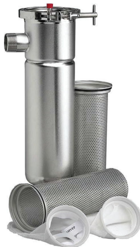
Filtration en mécanique.

Elle propose une véritable expertise dans les différents domaines de la filtration industrielle. Elle soumet des solutions et des services pour l'optimisation des processus de filtration et s'appuie sur de solides partenariats contractuels avec des fabricants de filtres industriels majeurs et reconnus internationalement. Etude technique, conseil, fourniture de corps de filtres et de cartouches filtrantes, amélioration continue des processus, logistique dédiée et personnalisée, Sofise peut être un partenaire en matière de filtration industrielle. Ses domaines d'intervention sont la filtration des liquides, de l'air et autres gaz et le transferts des fluides sensibles.