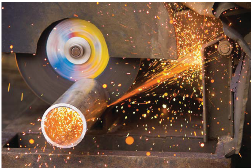
Filtration dans l'automobile.

tiel au bon fonctionnement et à la fiabilité des systèmes impliqués. La société se propose d'analyser les